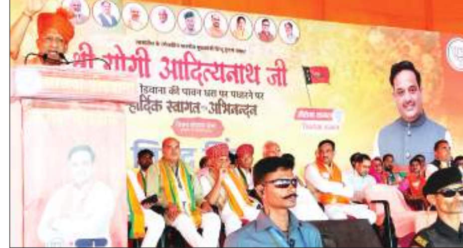
पूरी के मुख्यमंत्री योगी आदित्यनाथ ने बुधवार को जनसभा अलवर के सांसद व तिजारा से भाजपा उम्मीदवार महंत बालकनाथ के समर्थन में की। तिजारावासियों ने मोबाइल की लाइट जलाकर योगी आदित्यनाथ का अभूतपूर्व स्वागत किया।

पड़े हुए हैं। राजेश पायलट तो नहीं रहे, लेकिन उसकी जो लड़ाई है जो खुबसूरत है। वह बेटे पर भी निकाल रहे हैं। कांग्रेस तबाह हो जाए, लेकिन जो परिवार के खिलाफ जो आवाज उठाएगा उसको तो बर्बाद करके ही रहेंगे।