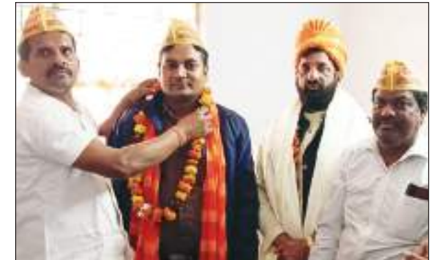
यादव ने बताया कि मैं देश के यादवों से अपील करता हूँ कि सभी यादव समाज के लोग 25 नवंबर को जंतर-मंतर पर पहुंचें। नरेला के सभी लोगों ने विश्वास दिलाया कि हम बहुतायत की संख्या में पहुंचेंगे ताकि सेना में जल्द से जल्द अहीर रेजीमेंट का गठन हो सके।