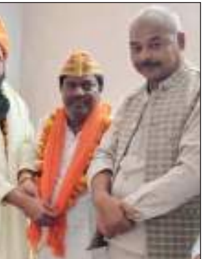
कार्यालय पर 25 नवंबर को दिल्ली के जंतर मंतर पर आयोजित होने वाले यादव शौर्य दिवस को लेकर मीटिंग का आयोजन किया गया।