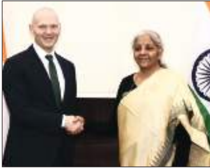
केंद्रीय वित्त मंत्री निर्मला सीतारमण से मुलाकात करते हुए स्वीडन के वित्ति मंत्री निकल्स।