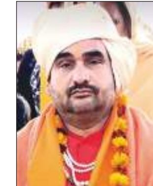
हजारों की संख्या में आने वाले श्रद्धालुओं के लिए पार्किंग की फ्री सेवा की जाएगी। यह हिन्दुओं एवं