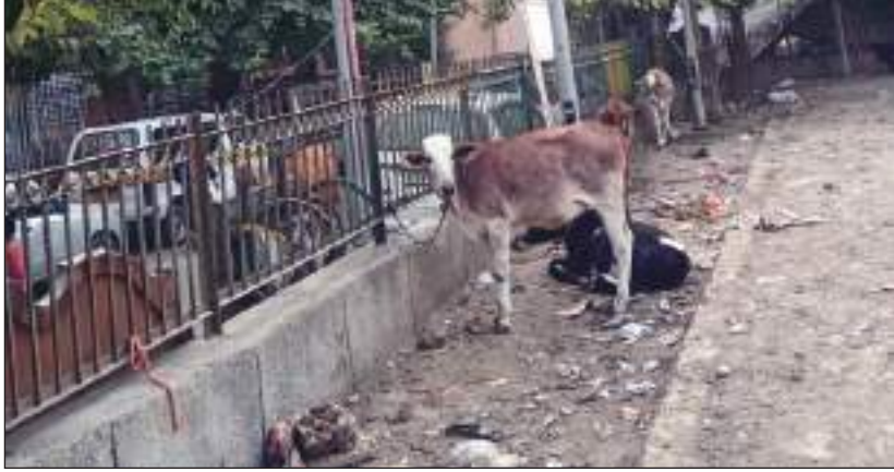
टीम एक्शन इंडिया/ नई दिल्ली त्रिनगर विधानसभा क्षेत्र के अंतर्गत आने वाले शकुरपुर के वार्ड नंबर-62 स्थित के ब्लॉक के महर्षि दुर्बल नाथ निगम का

पार्क सालों से उद्यान विभाग व निगम के संबंधित शासन-प्रशासन की लापरवाही का दंश झेल रहा है। देख-रेख के अभाव में पार्क की